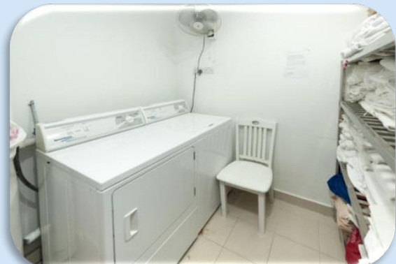
洗衣房 Laundry Room