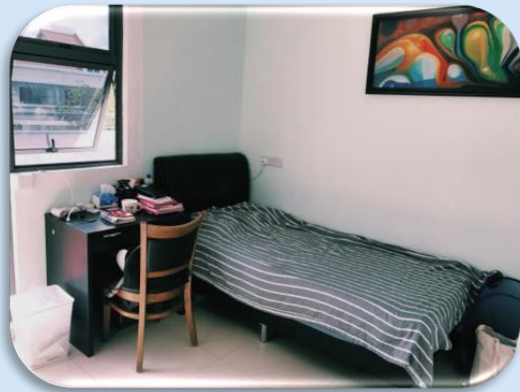
单人间 Single Room