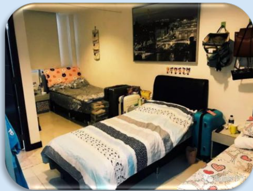
三人间 Triple Room