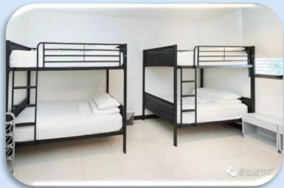
四人间 Quad Room